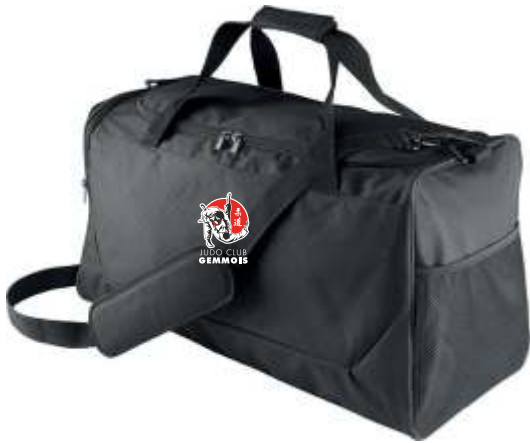
SAC 46 LITRES 22€