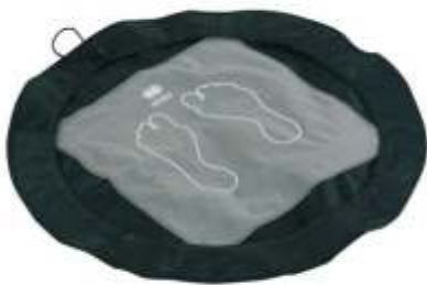
Tapis de douche