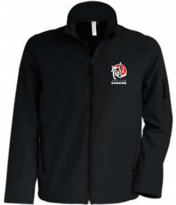
SOFTSHELL 3 COUCHES Imperméable. Enfant 42€ Adulte 52€