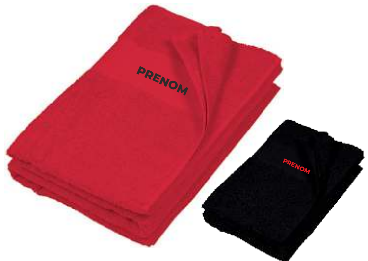
Serviette éponge 50x100cm